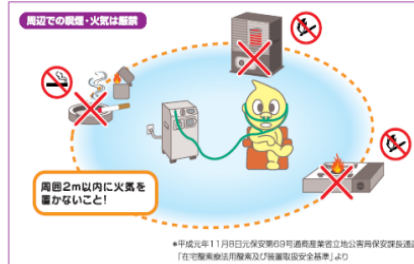
※平成元年11月8日公安委員会認可通商産業省立地公需再保安課取組通知「在宅酸素療法用酸素及び酸素濃縮装置安全基準」より